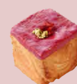
フランボワーズ FRAMBOISE ..... ¥400