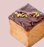
チョコレート CHOCOLATE ..... ¥400