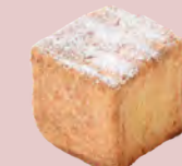
カスタード CUSTARD ..... ¥370