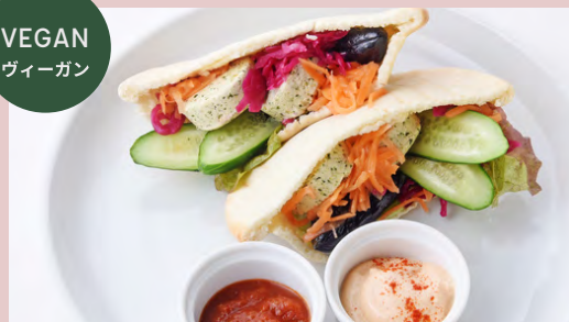
FALAFEL PITABREAD ファラフェルピタパン ..... ¥1,180