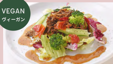
PLANT POWER SALAD NEXTハラミ ブロッコリーサラダ ..... ¥1,180