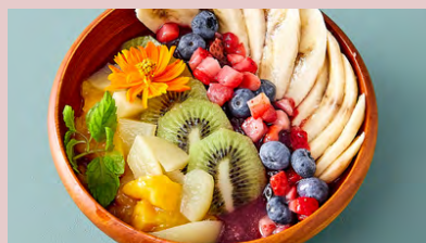
ACAI FRUIT BOWL アサイーフルーツボウル ..... ¥1,250