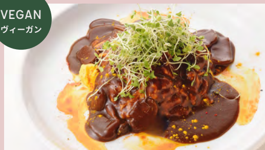
VEGETABLE OMELETTE RICE ベジオムライス ..... ¥1,280