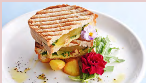
BRIE CHEESE & APPLE ルッコラとブリーチーズアップルナッツ ..... ¥1,180