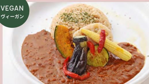
VEGETABLE CULLY ベジカレー グリル野菜添え ..... ¥1,280