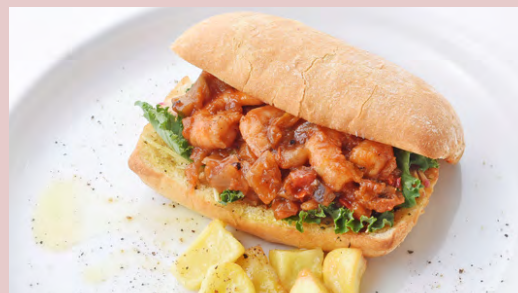
SHRIMP & RATATOUILLE エビとラタトゥイユチャバタ ..... ¥1,180