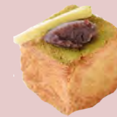
あんバター SWEET BEAN BUTTER ..... ¥390