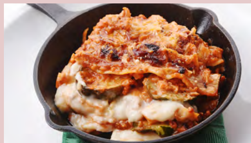
VEGETABLE MEAT LASAGNE ベジミートのラザニア ※パン付き ..... ¥1,280