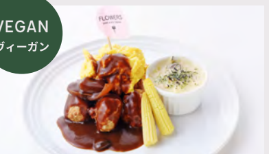
BOTANICAL KIDS PLATE ベジオムバーグ キッズプレート ※ドリンク付 ..... ¥1,100