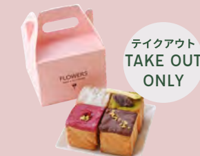
4種セットボックス ALL TYPES SET BOX ..... ¥1,500